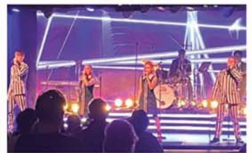
維京海王星4人合唱團