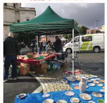
跳蚤市場 Feira da Ladra

旅遊資料只供參考，更多相片請登入 chewing33.blogspot.com 或聯絡電郵 chewing33@gmail.com