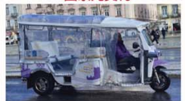
嘟嘟車 Tuk Tuk