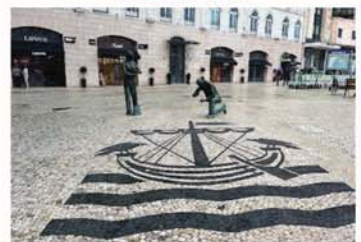
鋪石路工人紀念碑