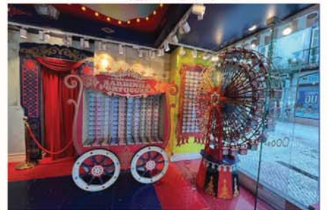
沙丁魚的奇妙世界

廣場西邊有間宛如遊樂場商店「沙丁魚的奇妙世界 O Mundo Fantástico da Sardinha Portuguesa」，店內摩天輪、旋轉木馬、皇座等。一牆色彩繽紛沙丁魚罐頭，每個罐頭標註不同年份，很興奮尋找出生年份沙丁魚sardinha，找到了！每罐7歐元起，多款罐頭選擇，這魚罐頭會打開來吃嗎？未完待續。