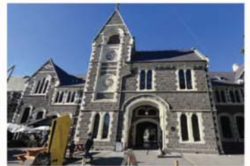
鐘樓和盧瑟福書房