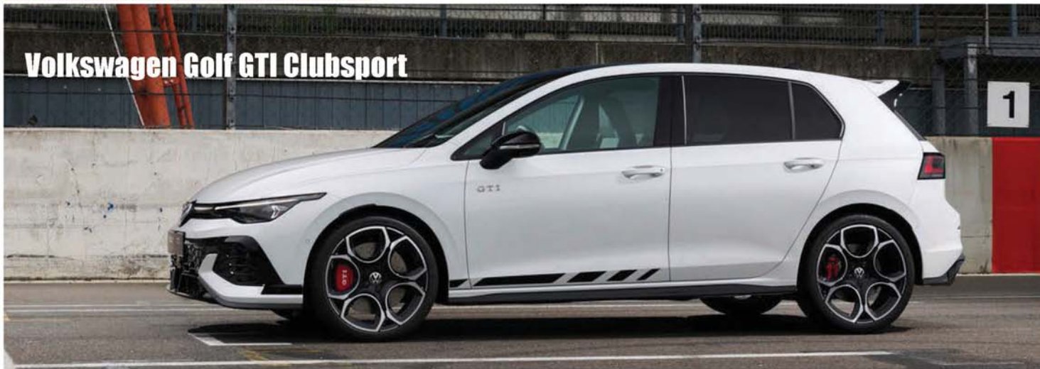
Volkswagen Golf GTI Clubsport

Tiguan、Tayron和Passat所搭配的新動力車型皆標配4MOTION四輪驅動，並且具備更出的拖曳能力。所有三款車型的四輪驅動均使用4MOTION離合器，其特點是具備智慧能源管理。在正常駕駛條件下，例如在沒有最大負載要求時，只有前軸提供動力，這樣可以節省燃料。後軸僅在負載要求較高或車輪失去抓地力的可能時才會介入，然而四輪驅動也可以透過手動介入。例如，為了在雪地道路上獲得最佳循跡能力。帶有可選球形聯軸器的四輪驅動車型提供了另一個技術特殊功能：也就是一旦4MOTION系統檢測到耦合的拖車，智慧4MOTION離合器在拖車牽引的前後軸之間會優化分配動力。