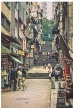
昔日洋船街

「這裡真的是『船街』？」太座望着街牌，一臉茫然，我拿出手機找出船街舊相對照，才認出來。翻查歷史，以前這裡是海岸，外國船停泊在此，所以叫洋船街，1842年移山填海至莊士敦道，設有碼頭泊船，莊士敦道通往皇后大道東（香港第一條大馬路）名為「船街」，舊樓拆卸重建，兩條街合併為船街。太座無限唏噓：「我住『洋船街』，