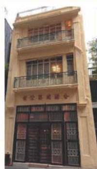
船街 18 號