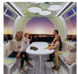
摩天輪內的包廂座椅