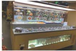
海抵撈自助醬料吧