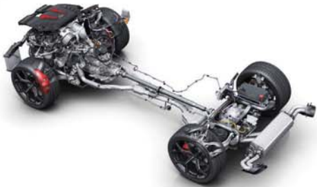
Audi RS Q8 performance Antriebsstrang Drehmoment 00/24

這些高階 Q8 車型配備採用蜂巢縫線的打孔運動化座椅，車內還配備 Alcantara 皮革包覆的方向盤，並使用回收寶特瓶再生製造的超細纖維製作排檔桿和其他區域。為獲得更大的舒適度，主動式氣壓懸掛是標準配備，可將行駛高度調整最多 3.5 吋。甚至還有機電式主動防側傾穩定系統和後輪轉向系統。