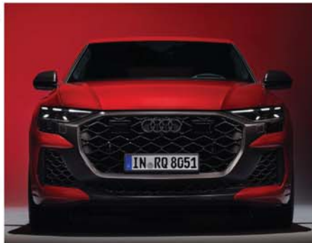
Audi RS Q8 performance Abgasanlage Emission System 00/24