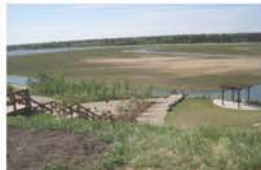
Great Blue Heron 野餐區