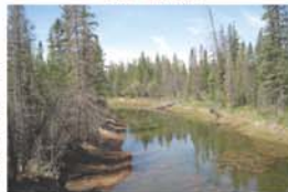
黃鼠狼自然環境公園

過了橋就是「黃鼠狼自然環境公園 Weaselhead Natural Environment Park」，彭先生宣佈：「時間有限，過了第二條橋就得回去。」第一條是水泥地橋，穿過叢林時，地面泥濘濕滑，第二條是優雅木橋，小橋流水，河面清晰印着綠樹倒影，感覺融入其中，頓覺寫意，快樂真是好簡單。希望能深入探索自然環境公園河流三角洲，開闊水域中，非常適合觀鳥，尋找其他公園不太可能看到物種。