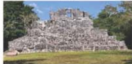
月亮女神寺廟(網上圖片)

旅遊資料只供參考，更多相片請登入 chewing33.blogspot.com 或聯絡電郵 chewing33@gmail.com