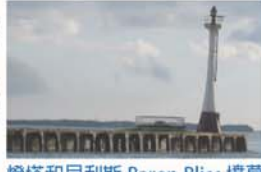
燈塔和貝里斯 Baron Bliss 墳墓

乘渡輪返船時，經過「喬治堡角 Fort George Point」，聳立建於1926年燈塔，由第五任男爵「貝里斯 Baron Bliss」捐資金建造，他還捐出鉅額金錢設立基金，為貝里斯城建造診所、圖書館等設施。他從未踏足貝里斯，但埋葬在燈塔前，設紀念碑。為紀念這位貝里斯恩人，每年3月9日他去世那天為國定假。沿海還有巍峨大酒店，旅遊業十分興旺。