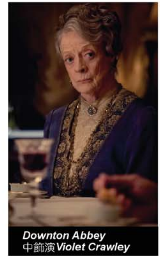
Downton Abbey 中飾演 Violet Crawley