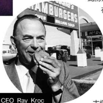
CEO Ray Kroc

點扮演麥當勞叔叔來遊行示威。但收效甚微，公司不得已在2014年之後改變麥當勞叔叔的形象，將其裝扮得更簡約和隨性。也重新裝修餐廳設計，讓其更現代感和簡約，針對的市場也不再只是兒童，而是各個不同年齡層。目前麥當勞叔叔雖然比以往少了很多露面機會，但在重要活動偶然也會出現。說起首任麥當勞叔叔Ronald McDonald，其實是一名當年在美國馬戲團極受歡迎的小丑，名叫Willard Scott，他擔任這個形象不到2年。當年的造型也比較古怪而且他身型較肥胖，麥當勞公司認為不符合形象，