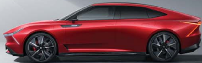
燁 GT Concept

車內寬敞的座艙讓前後座乘員在享受舒適乘坐的同時，本田表示，車主還能享受AI智慧化的駕駛體驗，儀表背光和門側飾板LED氣氛照明，都會隨著駕者的心情和駕駛風格而產生光和色調的變化。