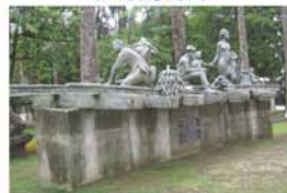
利蒙省發展紀念碑

旅遊資料只供參考，更多相片請登入 chewing33.blogspot.com 或聯絡電郵 chewing33@gmail.com