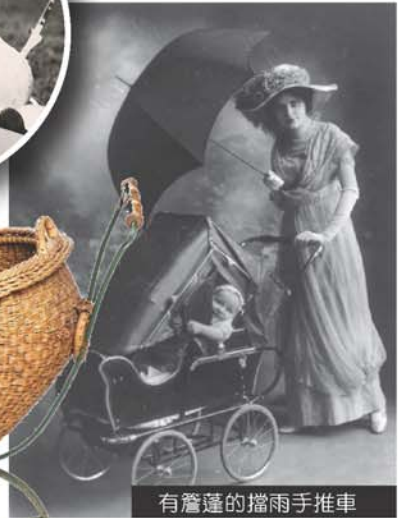
有簷蓬的擋雨手推車