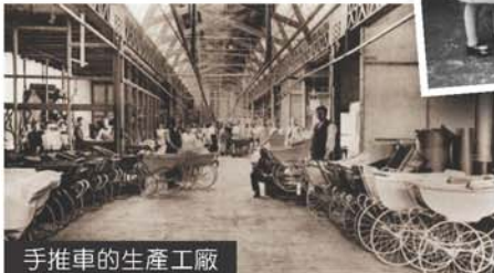
手推車的生產業廠

◆卡城本地資訊 獨家中文新聞內容◆ 每日本地新聞更新 歡迎到 隔週一週 TREND WEEKLY https://www.facebook.com/trend.weekly 查看