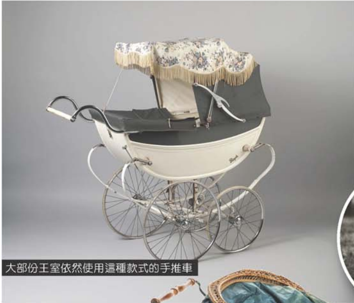
大部份王室依然使用這種款式的手推車