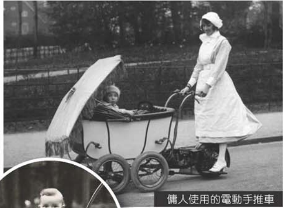
傭人使用的電動手推車