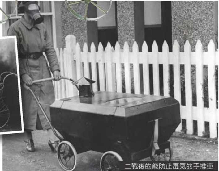
二戰後的能防止毒氣的手推車