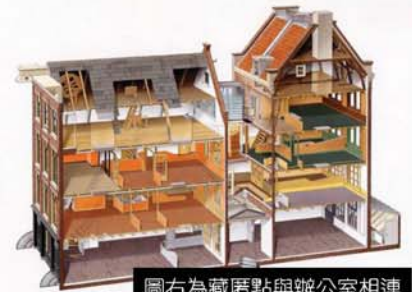
圖右為藏匿點與辦公室相連

及正在辦公室的Miep都被拘捕，帶隊的帝國保安部指揮官Karl Silberbauer在要求Miep不得逃跑後，允許她留在辦公室，其他人皆被帶回。拘捕行動當天，藏匿處的傢俱全被納粹