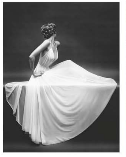
全球最老資格的女模特,身高 180cm,仙氣飄飄身姿依舊挺拔的 Carmen Dell'Orefice,在T台上活躍 了超過60年。截止2012年春夏時裝 周,當時高齡為81歲的她才正式退下 舞台。但偶然還會拍攝廣告,身型依 舊非常曼妙。出生於1931年美國紐約 的Carmen,今年已有92歲。Carmen