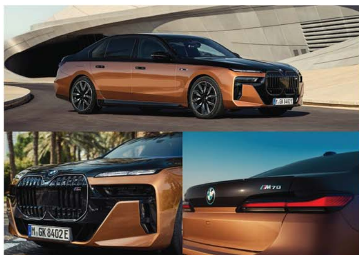
THE NEW BMW i7 M70. PERFORMANCE AND CHARGING.