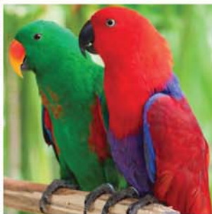
折衷鸚鵡

旅遊資料只供參考，更多相片請登入 chewing33.blogspot.com 或聯絡電郵 chewing33@gmail.com