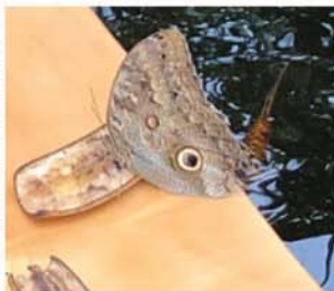
貓頭鷹蝶忙着吃香蕉

17「紅尾蠶莖 Pink Chenille Plant」，原產於東南亞熱帶雨林，開花時一條條鮮紅色穗狀花序垂下，像條尾巴，嬌豔奪目，又稱貓尾花、狗尾紅。白樹仙女蝴蝶 White Tree Nymph 唯一以這種植物為食的蝴蝶。實在受不了28度高溫，厚外樓一早除下，太座早有準備，拿出大袋裝衣服，身上脫剩一件恤衫都汗流浹背，熱到透不過氣，破例一小時未到便要匆匆結束，到外頭納涼。熱帶雨林出口連接紀念品店，出售與蝴蝶相關物品，蝴蝶標本和受歡迎雀鳥相片。未完待續。