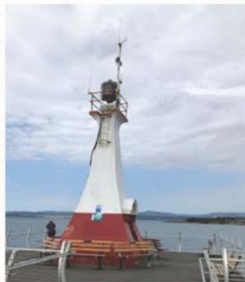
奧格登角防波堤燈塔

原住民雪鞋。不久又見到用毛筆畫的白頭鷹鷹頭，頸部帶着鮮紅血蹟，煞是好看。烏雲密布，翻起寒風，拉着太座急急腳返回旅遊車。上車後開始下雨，太座左眼看到黑雨點，她滴了隨身眼藥水閉目養神。車前往下一個景點，1963年正式成立維多利亞大學 University of Victoria，是加拿大知名大學，吸引世界學生來讀書。旅遊車在校園慢駛，雨中一座座平房校舍沒啥看頭，團友提出去其它地方，導遊想一想，決定看燈塔。雨停了太座左眼異像也消失了。太座一點不害怕，有菩薩保佑，笑稱「它」顯現神聖美景是獨家福利。為確保安全，返回卡加里太座立即看眼科醫生，檢查後一切正常。