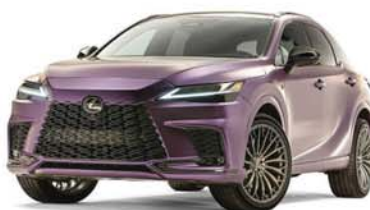
RX 500h F Sport Performance Concept