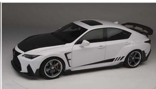
IS 600 Pjct Built by DSPORT