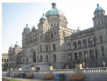
卑詩省省議會大樓

省議會大樓西側對面馬路是寧靜「聯邦廣場 The Confederation Garden Court」建於1967年，紀念加拿大建國一百周年，廣場中央是三層大噴泉，石牆上瀑布傾瀉而下，瀑布前矗立加拿大國徽，瀑布兩側各有加拿大十三個省和地區盾牌，盾牌下有名稱和加入聯邦年份。太座發現1967年埋在8呎長混凝土下時間囊，時間囊內有報紙、雜誌、唱片和記錄百年紀念的電影等，一百年後2067年才打開。未完待續。