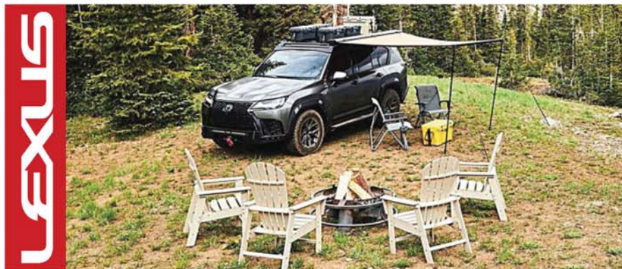
LX 600 Alpine Lifestyle Concept