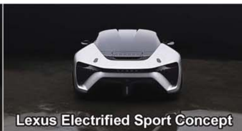
Lexus Electrified Sport Concept