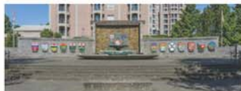
聯邦廣場(網上圖片)

旅遊資料只供參考，更多相片請登入 chewing33.blogspot.com 或聯絡電郵 chewing33@gmail.com