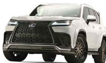
LX 600 Urban Concept

另一台性能改裝的 RX500h F-Sport Performance，其車身採用了消光紫色金屬塗裝，並配備22吋 Rays Engineering Homura 2x15BD 的古銅色輪圈和米其林Pilot Sport高性能輪胎，整體運動氣息十足。最後是凌志的電動運動化概念車Lexus Electrified Sport，此車曾於去年年底首次曝光，並在本年的英國Goodwood速度嘉年華車展中首度公開亮相，RX500h F-Sport Performance 凸顯了純電動車將進化成為新世代超跑的發展趨勢，具有700公里的續航里程，靜止起步加速至每小時100公里只需不到兩秒。