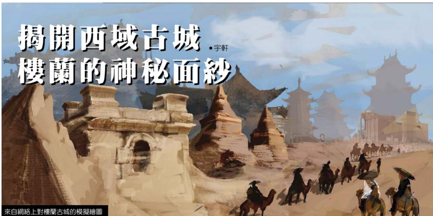
來自網絡上對樓蘭古城的模擬繪圖