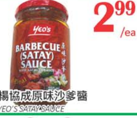
2.99 /ea 楊協成原味沙爹醬 YEO'S SATAY SAUCE