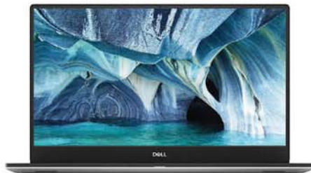
2019 XPS 15 7590

客戶可以選擇6芯97瓦時的鋰離子電池，支援Express Charge，以獲得最長的電池壽命。對於那些喜歡輕量級筆記本的用戶，還有3芯56瓦時的鋰離子電池。為了提供出色的音頻體驗，戴爾還提供了2個立體聲低音單元 (2.5W) 和2個立體聲高音單元 (1.5W)。為了管理筆記本電腦中強大CPU和GPU所產生的熱量，戴爾還改進散熱管理方案，採用了雙對置出口風扇和熱均板散熱。XPS 15 9500也會有類似的改進，但與XPS 17 9700相比，還是有一些區別。在 XPS 15 9500 上，NVIDIA GeForce 1650 Ti 6GB是唯一的GPU選項。另外，消費者可以配置的最大存儲空間為2TB。