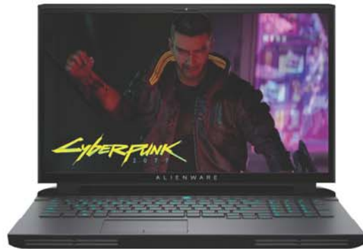
Alienware Area 51m

Alienware Area-51m R2 遊戲本將於 6 月 9 日先行在美國上市，起價 3049.99 美元。