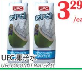
3.29 /ea UFC 椰子水 UFC COCONUT WATER 1L