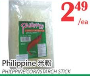
2.49 /ea Philippine 米粉 PHILIPPINE CORNSTARCH STICK