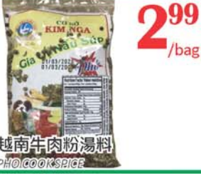
2.99 /bag 越南牛肉粉湯料 PHO CO OMSRICE