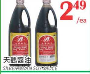
2.49 /ea 天鵝醬油 SILVER SWAN SOY SAUCE