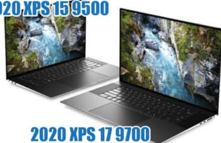
2020 XPS 17 9700