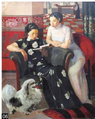
圖1 常書鴻在法國里昂時期用油畫畫的妻子、女兒及自己的全家福。