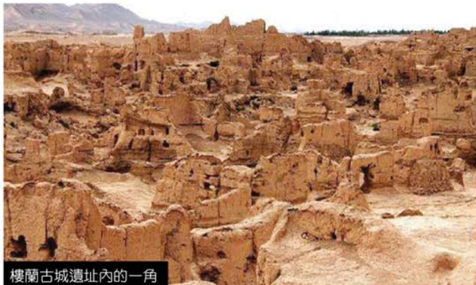
樓蘭古城遺址內的一角

近日不少盜墓劇播出後都引來不少反響，如鬼吹燈系列等。其中在《精絕古城》中描述過的在沙漠中的樓蘭古城最為神秘，今日宇軒就為大家揭開這座古城的面紗。