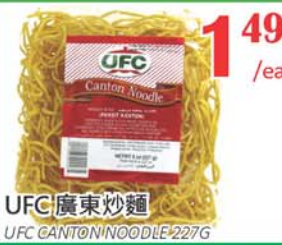
1.49 /ea UFC廣東炒麵 UFC CANTON NOODLE 227G