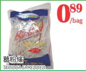
0.89 /bag 葛粉條 TARO SHREDDED