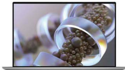
2020 XPS 15 9500