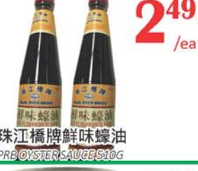
2.49 /ea 珠江橋牌鮮味蠔油 PRO OYSTER SAUCE 510G