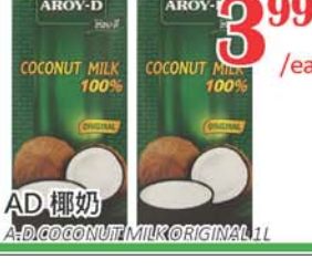
3.99 /ea AD 椰奶 A-D COCONUT MILK ORIGINAL 1L