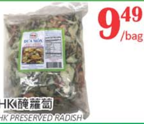
9.49 /bag HK醃蘿蔔 HK PRESERVED RADISH