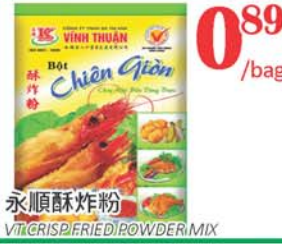
0.89 /bag 永順酥炸粉 VTK CRISPY FRIED POWDER MIX