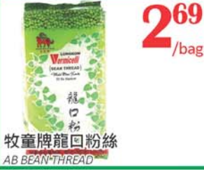
2.69 /bag 牧童牌龍口粉絲 AB BEAN THREAD