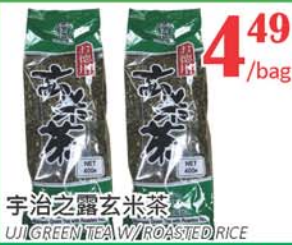
4.49 /bag 宇治之露玄米茶 UJ GREEN TEA/ROASTED RICE