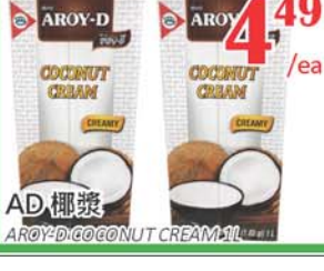
4.49 /ea AD 椰漿 AROY-D COCONUT CREAM 1L