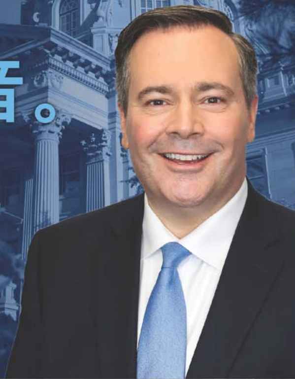
Honourable Jason Kenney Leader of the United Conservative Party Government Caucus