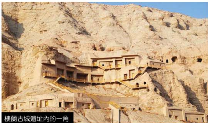
樓蘭古城遺址內的一角