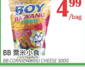
4.99 /bag BB 粟米小食 BB CORNICK CHILI CHEESE 500G