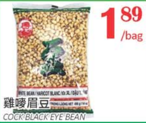
1.89 /bag 雞嘜眉豆 COCK BLACK EYE BEAN