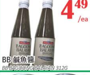
4.49 /ea BB 鹹魚醬 BB BAGOONG BALAYAN 312G