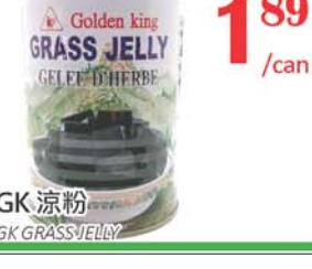
1.89 /can GK 涼粉 GK GRASS JELLY