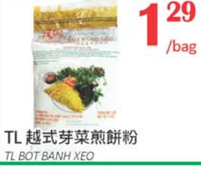
1.29 /bag TL 越式芽菜煎餅 TL BOT BANH XEO