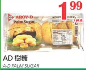
1.99 /ea AD 樹糖 A-D PALM SUGAR