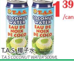
1.39 /can T.A.S. 椰子水 T.A.S. COCONUT WATER 500ML