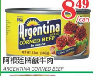
8.49 /can 阿根廷牌鹹牛肉 ARGENTINA CORNED BEEF