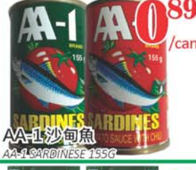
0.89 /can AA-1 沙甸魚 AA-1 SARDINES 155G