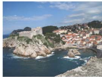
羅維里耶納克碉堡

完整「聖克萊爾女修道院 Convent of St. Claire」，中庭擺滿桌椅，現已改為 Klarisa 餐廳。而民居曬晾衣物，雅緻後院花草茂盛。全長兩公里城牆上，不同時期威脅，不斷地加高、加厚、陡峭石級、方形塔、小門內窄樓梯等防禦措施。從這個角度看，古城建在一塊突出於海面的巨大岩石上。城牆外，一望無際蔚藍色亞德里亞海，藍天萬里，不同藍色組成天然美景，心曠神怡。回頭望，從另一角度看兩個碉堡，波克爾碉堡 Bokar Fort 與「羅維里耶納克碉堡 Lovrjenac Fort」，連接小海灣內的紅屋頂，巧妙配合迷人境界。獨木舟健兒們技藝嫻熟劃破水面，遊艇駛過遍佈泳客沙灘，舒服氛圍度假天堂無誤。「聖約翰碉堡 St. John's Fort」現為海洋博物館，一邊是長方形另一邊是半圓塔，1557年就屹立海岸邊，向海城牆上公認最悲壯「聖布萊斯」像守護港口。站在碉堡頂層平台稍稍休息，制高點擺放大砲、峭岡、小廣場設有商店和餐廳，碧藍耀眼海上，近處橫臥「洛克盧島 Lokrum Island」，遠方大大小小島嶼，遼闊景色盡納眼底，所以一定要陽光普照來，捕捉最美一刻。未完待續。