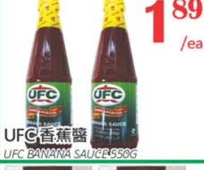
1.89 /ea UFC 香蕉醬 UFC BANANA SAUCE 550G