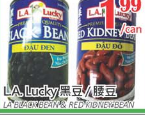
1.99 /can LA Lucky 黑豆/腰豆 LA BLACK BEAN & RED KIDNEY BEAN